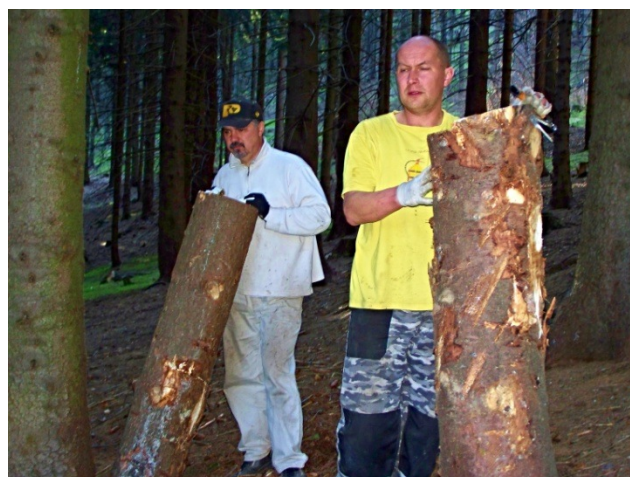
Ukládání dříví na hromadu.