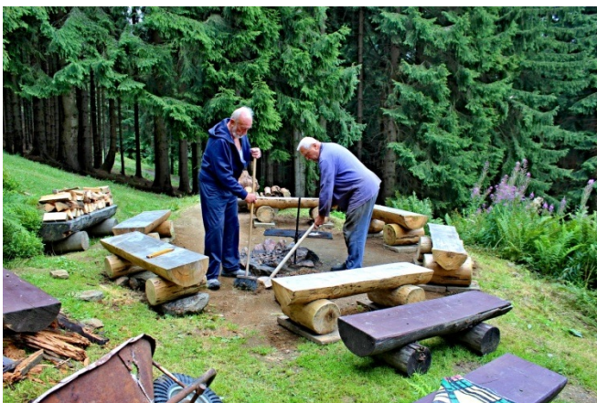
Celková úprava ohniště.