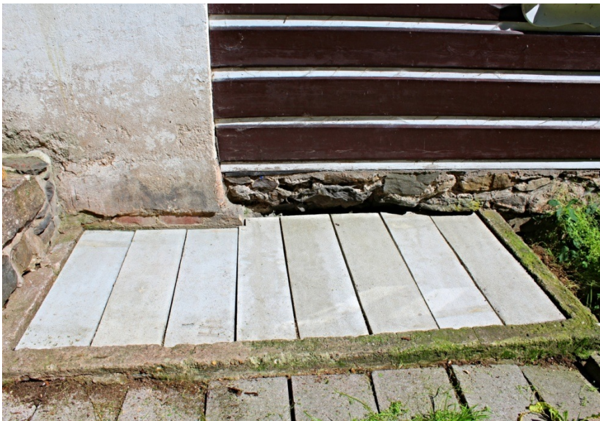
Staré fošny jsme nahradili betonovými deskami.