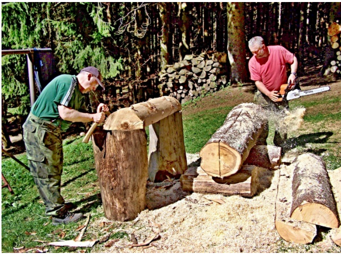
Ze silnějších kmenů vyrábíme sedačky.