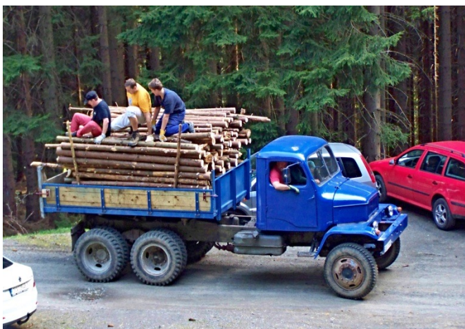
Naši dřevorubci přivezli z lesa pěknou fúru dřeva.

Měli jsme ještě v plánu znovu položit betonové dlaždice za chalupou na pořádný štěrkový podklad, ale to si již musíme nechat na jaro 2017.