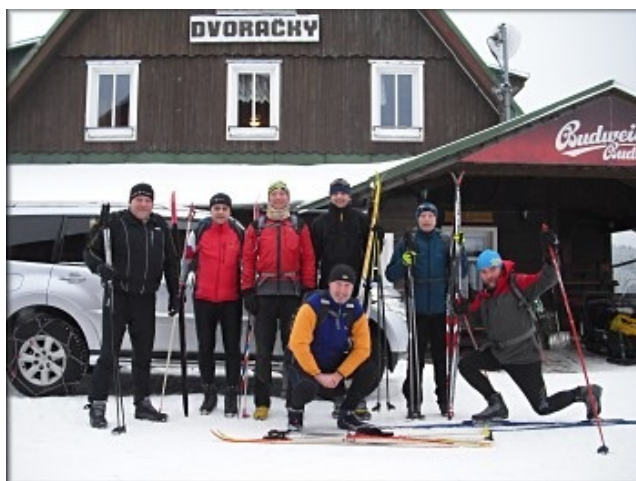
Účastníci Přejezdu Krkonoš u Dvoraček.

Vědomi si toho, že nás čeká už jenom posledních 3.5 km sjezdu, jsme z hospody nespáchali. Před odjezdem jsme u Dvoraček ještě nafotili kompletní společný snímek všech účastníků Přejezdu a asi v 16:40 vyrazili na Staropackou boudu.