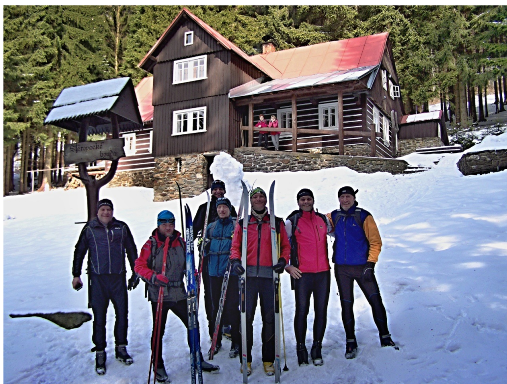
Ráno před startem do druhé etapy.