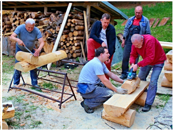
Jde nám to docela dobře.