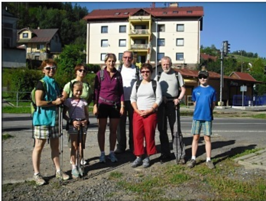
Účastníci Vejšlapu 2016 před zastávkou Plavy.

Poslední dva roky jsme se pohybovali v jižnější části Českého ráje. Letos jsme proto zavítali více na sever do krásných míst železnobrodská. Trasa byla naplánována Palackého stezkou z Plavů do Spálova divokým údolím řeky Kamenice.