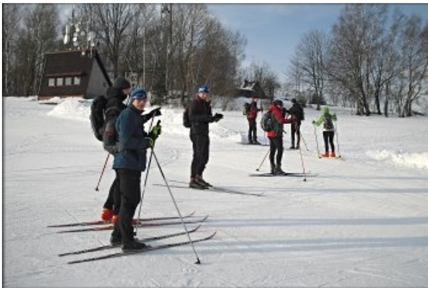
Účastníci Lyžařského přejezdu Jizerských hor a Krkonoš 2015.

Z Šachet jsme pokračovali v naplánované trase do Sklenařic (3 km) a kolem hospody Mexiko na Tomášovy vrchy (4 km). Za chatou na Perličku (5,7 km) jsme se dostali na upravené lyžařské stopy, po kterých jsme pokračovali k Chatě Hvězda pod rozhlednou Štěpánkou. (8,4 km) To už jsme byli v Jizerských horách a čekal nás krásný sjezd do Kořenova. (10 km) Odtud jsme se vydali směrem na Horní Polubný. (12 km) Od kostela v Polubném jsme již po perfektně upravených jizerských stopách dojeli na Mořinu pod Bukovec. (16,7 km)