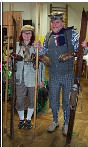
Lyžníci z počátku dvacátého století.