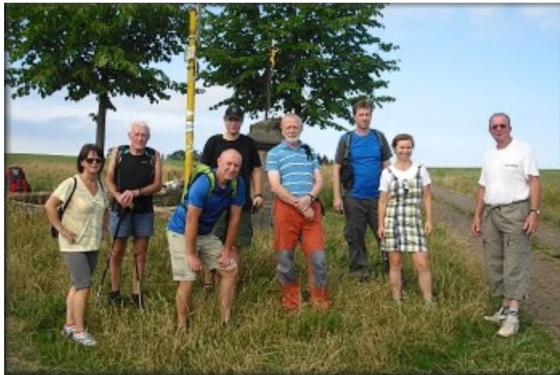
Účastníci Vejšlapu Podkrkonoším.

Na Táboře (678 m.n.m.) jsme se moc nezdržovali. Rozhlednu jsme si prohlédli jen ze země a pokračovali přes Chlum k Ploužnici. Zde jsme se odměnili jedním pivkem a pokračovali k Syřenovu. Ve známé výletní restauraci Klepanda jsme se opět zastavili na malém občerstvení. Z Klepandy nás čekala už jen cesta kolem Kumburku přes Brdo do Staré Paky.