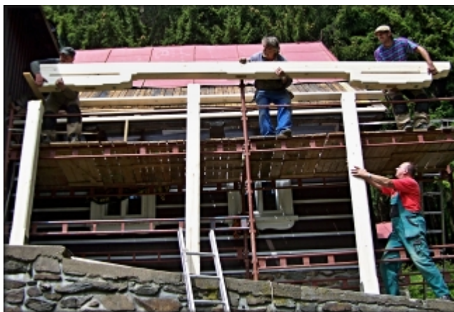
Montáž dřevěné konstrukce zastřešení.