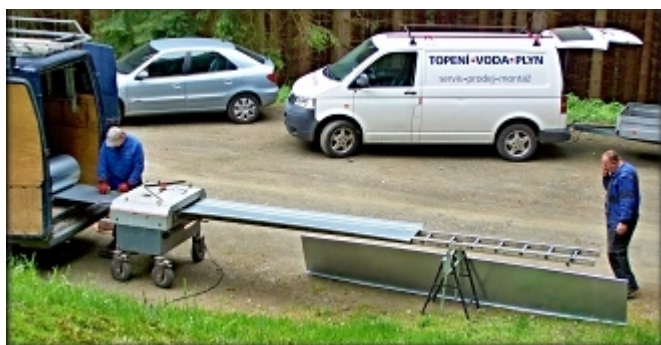
Klempíři si přivezli moderní mechanizaci.

V dalším týdnu, od středy 27. do pátku 29. května 2015 akce pokračovala. Ve středu jsme znovu postavili lešení, tentokrát pro klempíře. Klempíři přijeli ve čtvrtek přesně v 6:00 hodin ráno jak nám slíbili. Také oni si dovezli celou pojízdnou klempířskou dílnu. Univerzální stroj jim z velké role pozinkovaného plechu ustříhl potřebný díl a provedl na něm i všechny ohyby. Klempíři jej potom jen připevnili na střechu. Klempířské práce byly dokončeny ve čtvrtek 28. května 2015 ve 13:00 hodin.