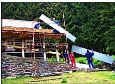
Klempířům jde práce dobře od ruky.

Po celou dobu provádění tesařských i klempířských prací nám počasí přálo. Bylo sice docela chladno, ale zato „ani nekápló“. První déšť však přišel ihned v noci z 28. na 29. května. Nová střecha byla tak úspěšně otestována. Tesařské i klempířské práce byly provedeny opravdu kvalitně.