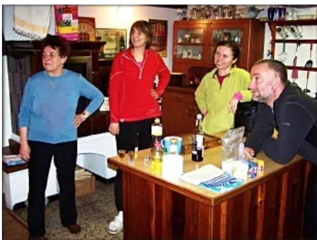
A to jsou naše hostesky, co se o nás vždy dobře starají.

Řádně vyhladovělí jsme si v Boudě pod Bukovcem doplnili kalorie a před sjezdem do Martinského údolí jsme nezapomněli ani potěšit ducha hor. (17 km) Frčeli jsme z kopce kolem Jizerského viaduktu (22 km) až k mostu přes Jizeru, kde už je Krakonošovo. (23,7 km) Zde nás již čekalo jenom stoupání na nádraží Harrachov (25,4 km). Vzhledem k pokročilému času jsme rozhodli, že tradiční návštěvu ve Formance v Harrachově vynecháme. Přišlo nám tedy vhod, když se u nádraží objevilo větší taxi, které nás za 200,- Kč svezlo až k lanovce pod „Čerták“. Před posledním stoupáním na Studenov (35,5 km) jsme si v hospodě „U Krtka“ dali pár piv. Ze Studenova jsme jeli po hřebenové cestě na křižovatku nad Staropackou boudou. Na boudu jsme pak sjeli již bez problémů.