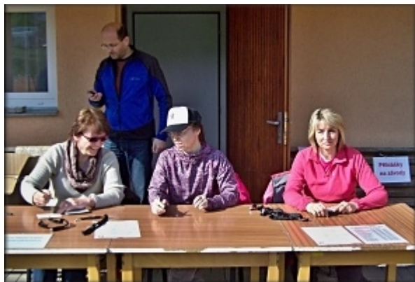
Zapisovatelky jsou připraveny a čekají na první závodníky.