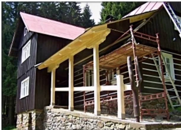
Tesařské práce jsou dokončené.

Po dohodě s vedoucím tesařské firmy jsme si dovezli a postavili lešení. Další den se dostavila parta tří zkušených tesařů, kteří si dovezli veškerou potřebnou mechanizaci. Opracování jednotlivých dílů prováděli na dvorku za chalupou. Z nich potom zhotovili nosnou konstrukci celého zastřešení. Následující práce, jako provedení bednění a zakrytí střechy lepenkou, jsme si již provedli svépomocí.