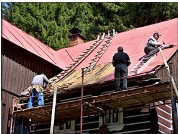
Rozkrývání plechové krytiny střechy.

Ve čtvrtek 21. května 2015 jsme zahájili několik let odkládanou stavební akci „Zastřešení zápraží Staropacké boudy“.