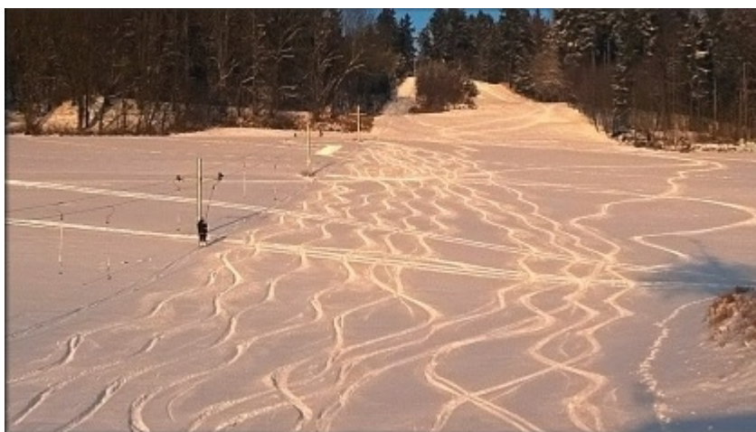
7.1.2015 Krásně vykreslené obloučky na cvičném svahu.