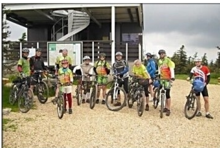
Účastníci cyklo-výletu v cíli.

Jedenáct nás osedlalo bicykly a vydalo se na trasu vstříc nepohodě. Z boudy jsme zvolili poměrně prudké stoupání na vrcholovou cestu nad boudou. Odtud nás čekal tradiční sjezd lesní pěšinou ke Kládovce po níž jsme pokračovali na Krakonošovu snídani. Dále pak Terexem na celnici v Novosvětském průsmyku. Odtud přes polské Jakuszyce, osady Orle a Górzystów, Polanu Izersku a po telegrafní cestě na Smrk. Plánovaného cíle jsme dosáhli kolem čtrnácté hodiny. Duch hor k nám byl příznivě nakloněn, takže jsme za celou cestu na Smrk skoro ani nezmokli.