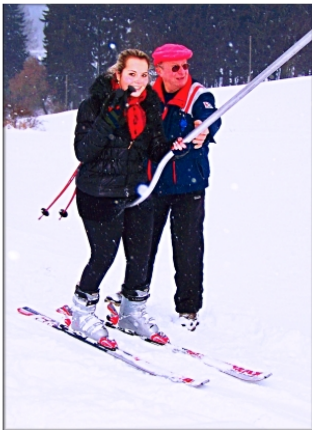
Poprvé se mohli svézt i první lyžaři.