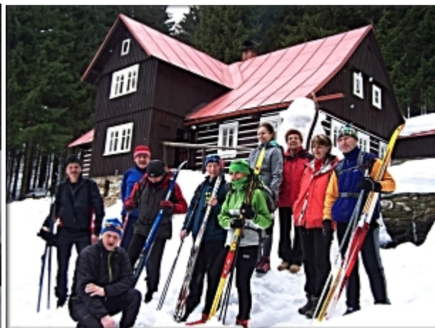
Také hlavní skupina je připravena vystartovat.