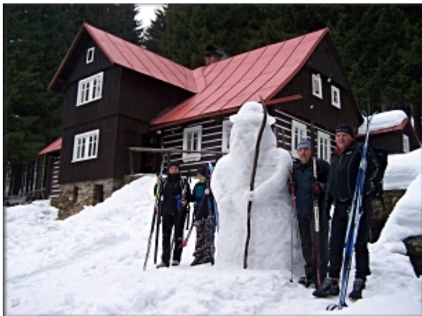
Menší skupina před startem do druhé etapy.

V neděli si trasu jednotlivé skupiny určily samy dle svého uvážení v délkách od 10 do 15 km. Závěrečné zhodnocení celého Přejezdu 2015 jsme provedli v „Hospůdce na Lajně“ ve Staré Pace.