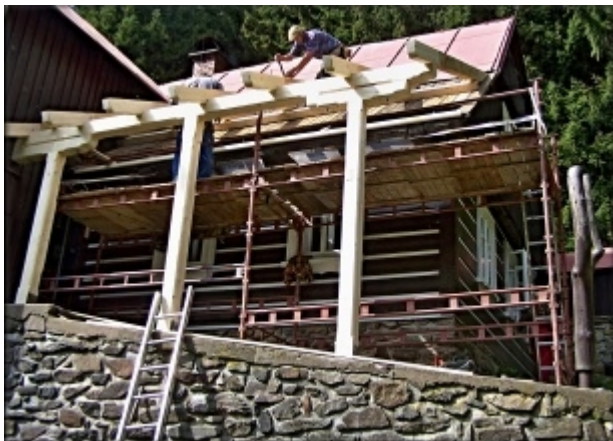
Dokončování dřevěné konstrukce.

Již počátkem letošního roku byly vypracovány stavební výkresy, které byly po schválení Správou KRNPu ve Vrchlabí předloženy Stavebnímu úřadu v Rokytnici nad Jizerou. Po jejich kladném vyřízení byli osloveni dodavatelé tesařských a klempířských prací.