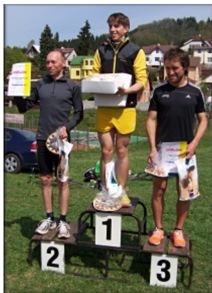
Nejlepší závodníci v kategorii mužů.