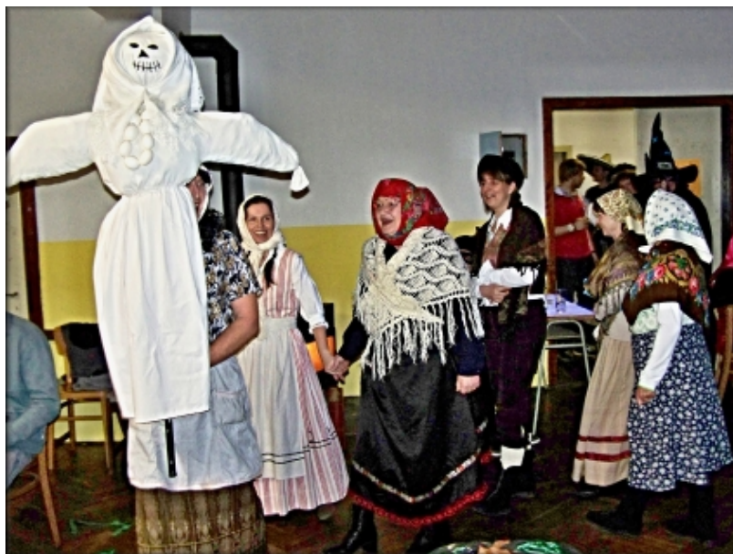
Vesničané vynášejí Moranu.

Na první jarní den, v sobotu 21. března 2015 uspořádal Oddíl lyžování TJ Sokol Stará Paka v Kulturním domě Roškopov XIV. Lyžařský maškarní bál. Protože právě začínalo jaro, připomenuli jsme si ho starým slovanským zvykem, a to vynášením „Morany“.