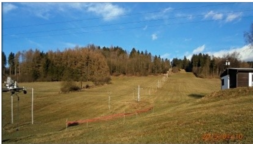
10.1.2015 Sjezdovka je po silné oblevě zcela bez sněhu.

Ale bohužel, svatý Petr to měl naplánované jinak. V sobotu, když se na chvíli vyjasnilo, to na sjezdovce vypadalo doslova jako na jaře.